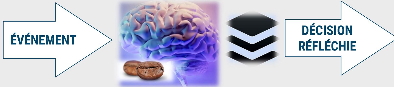
Schéma 3 (avec buffer installé)

ON A UN BUFFER : NOTRE MÉTIER CONSISTE À UTILISER LES ÉVÉNEMENTS POUR S'AMÉLIORER COMME HUMAINS