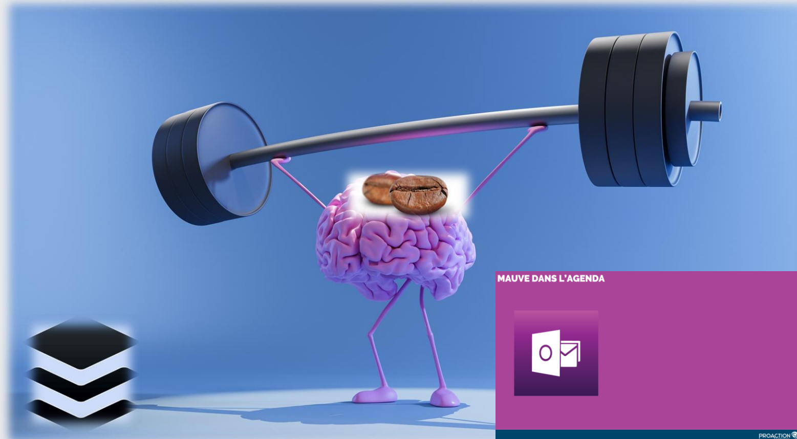
Schéma 2 (entraînement pour installer un buffer)