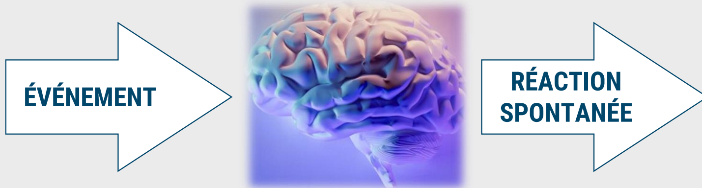
Schéma 1 (sans buffer)